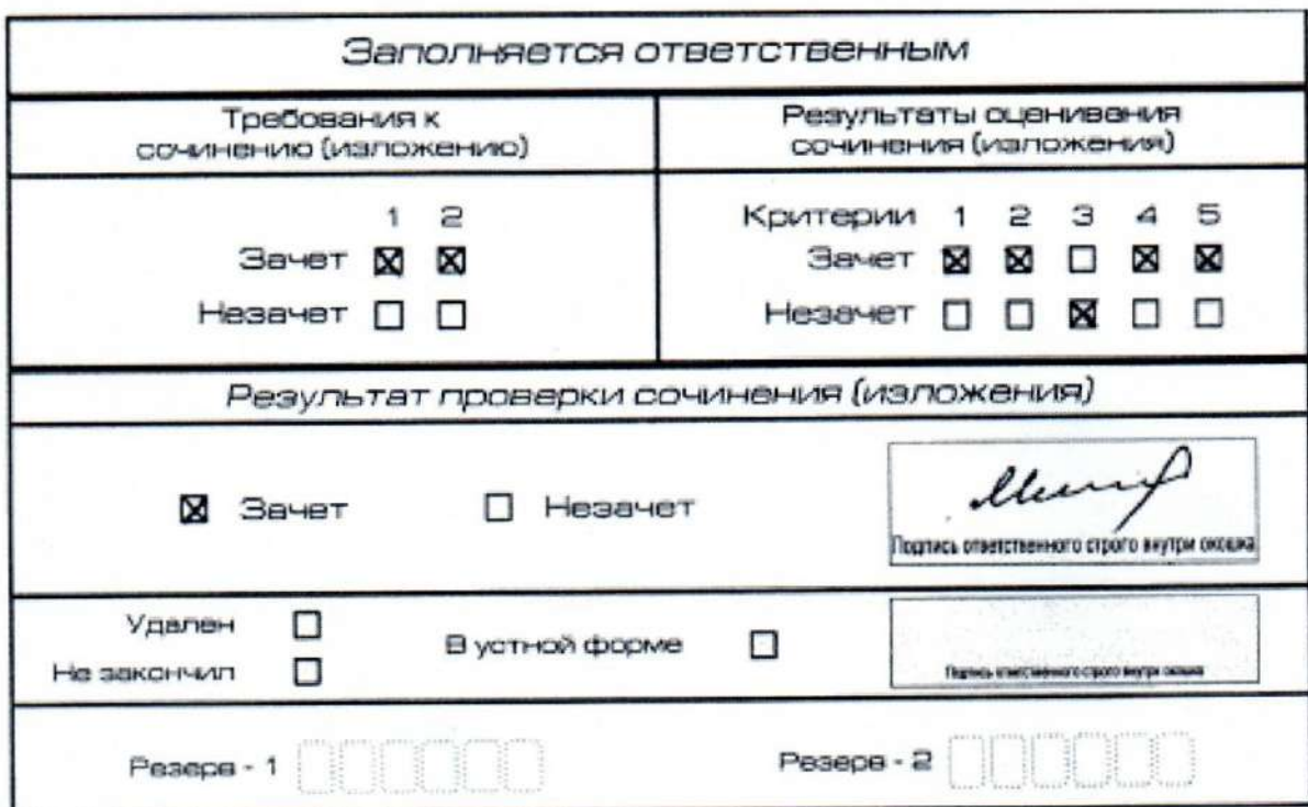
Рис. 11. Область для оценки работы