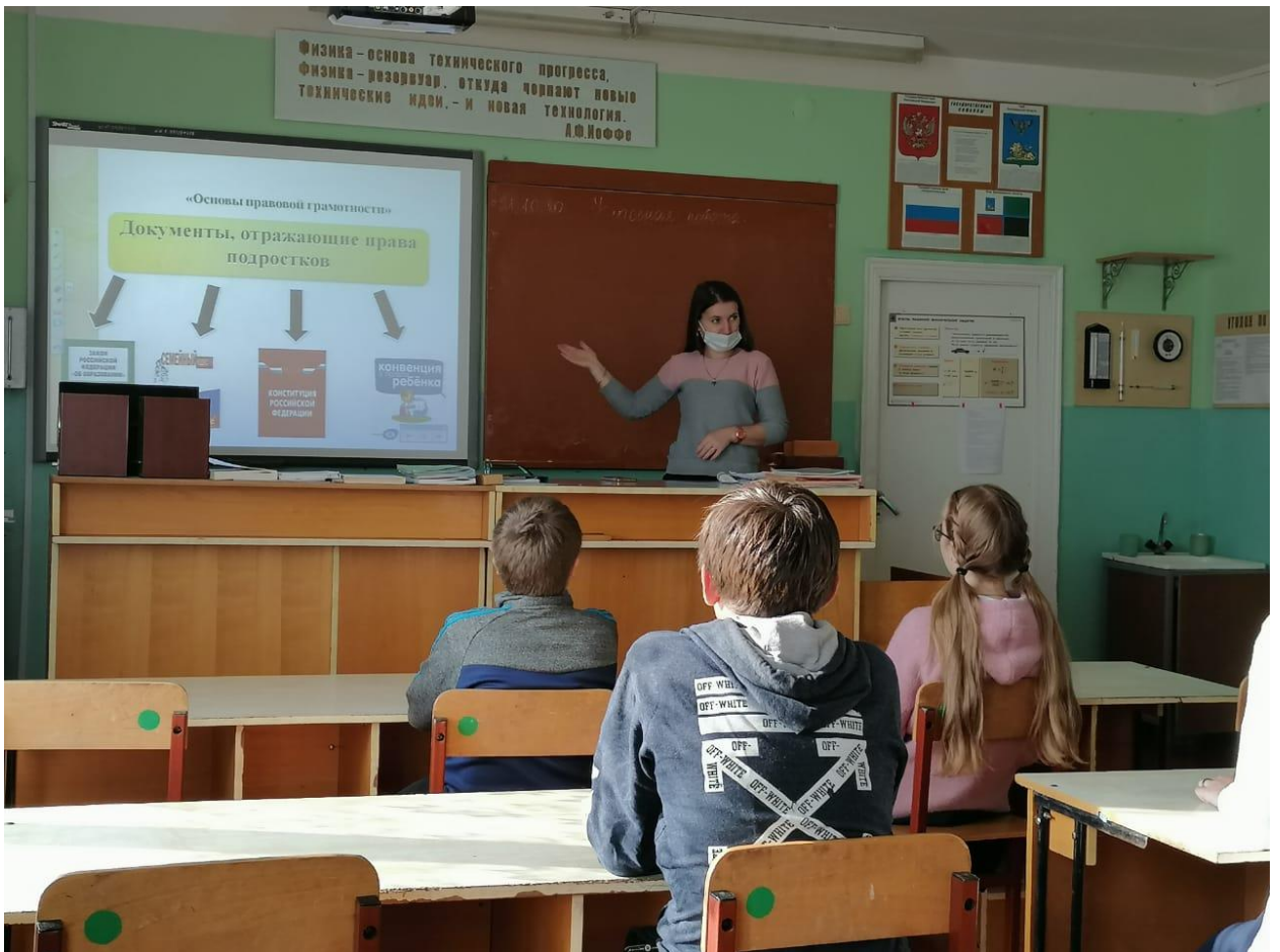
МОУ «Лесноуколовская оош»